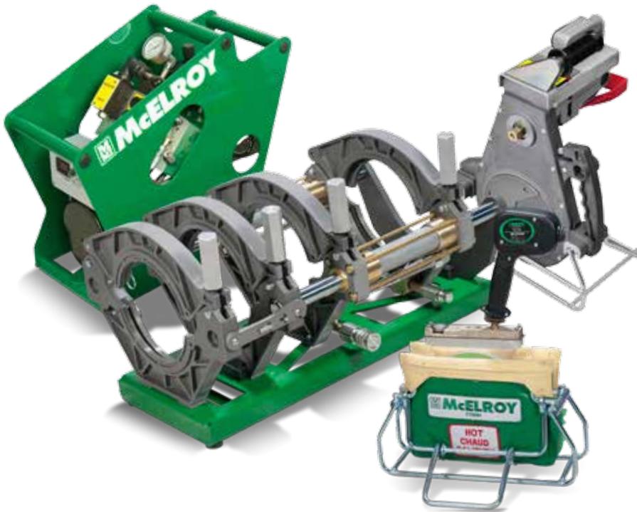
Acrobat™ 160 Paquete

Capacidad de fusión de 63 mm a 160 mm tubería de polipropileno